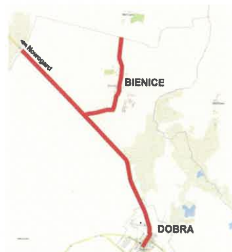
Rys. Lokalizacja modernizacji drogi powiatowej nr 4182Z i 4182Z

Inwestycja obejmuje ulicę Bohaterów Westerplatte i Nowogardzką w Dobrej, odcinek drogi od ulicy Nowogardzkiej do skrzyżowania z drogą w kierunku Bładkowa oraz całą drogę przechodzącą przez miejscowość Bienice.