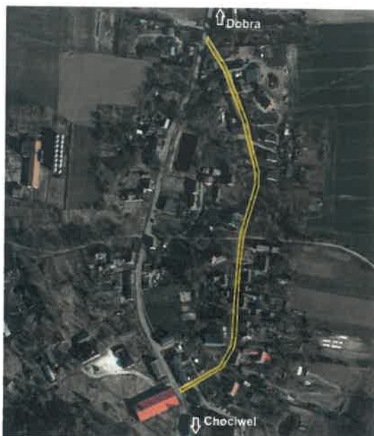
Rys. Lokalizacja przebudowy drogi wraz z infrastrukturą w miejscowości Dobropole

sprawie „zamiaru wykonania robót budowlanych, polegających na przebudowie drogi gminnej w miejscowości Dobra na terenie działek oznaczonych numerami ewidencyjnymi 431/2, 141, 118, 123, 100, 56/2 obręb Dobropole, gmina Dobra.