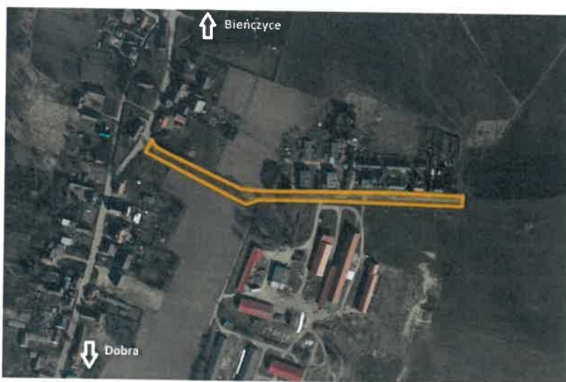
Rys. Lokalizacja budowy drogi wraz z oświetleniem w miejscowości Bienice

W postępowaniu przetargowym wybrano najkorzystniejszą ofertę złożoną przez PRD Nowogard S.A., który zaoferował wykonanie tej inwestycji za kwotę 1.990.744,56 zł.